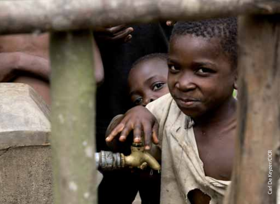
Carl De Keyzer/CICR