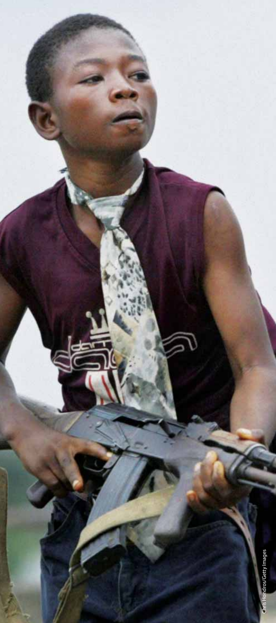
Chris Hondros/Getty Images