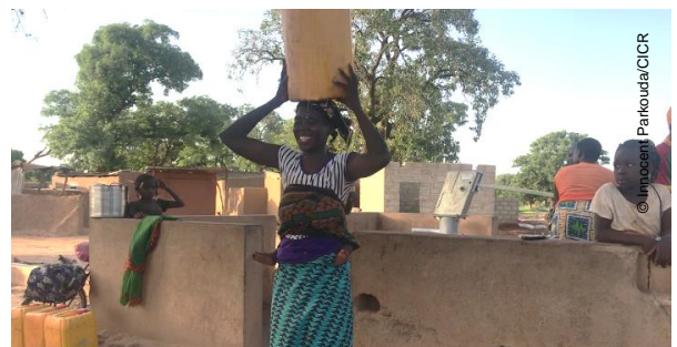
Une femme emporte un bidon d'eau à un forage réhabilité par le CICR à Fada N'Gourma

7 800 personnes (déplacées et hôtes) ont un meilleur accès à l'eau potable grâce à la construction de 2 nouveaux forages dans la région de l'Est (Fada N'Gourma et Gayéri) et la réhabilitation de 24 forages dont 3 à Djibo (région du Sahel), 21 dans la région de l'Est (Fada N'Gourma, Matiakoali, Ougarou, Gayéri, Foutouri et Tankoulou).