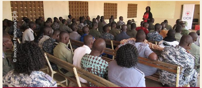
Séance de sensibilisation sur le DIH et le DIDH auprès des Gardes de sécurité pénitentiaire