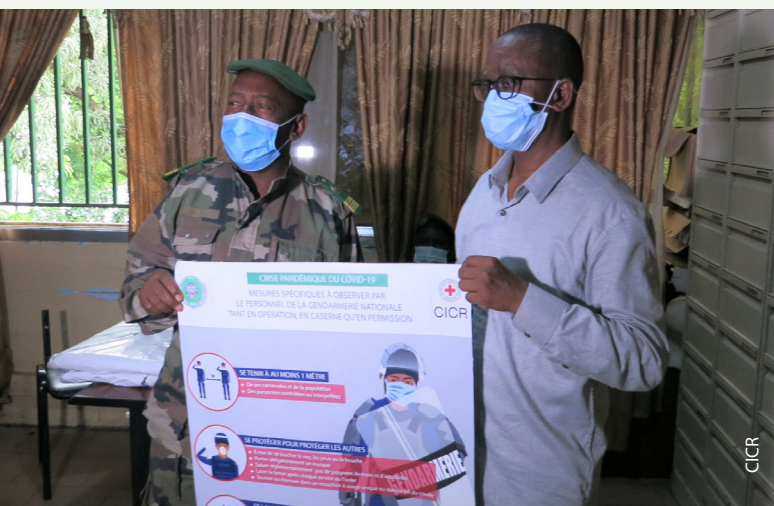
Remise des affiches à la Gendarmerie guinéenne pour sensibiliser sur la Covid-19.