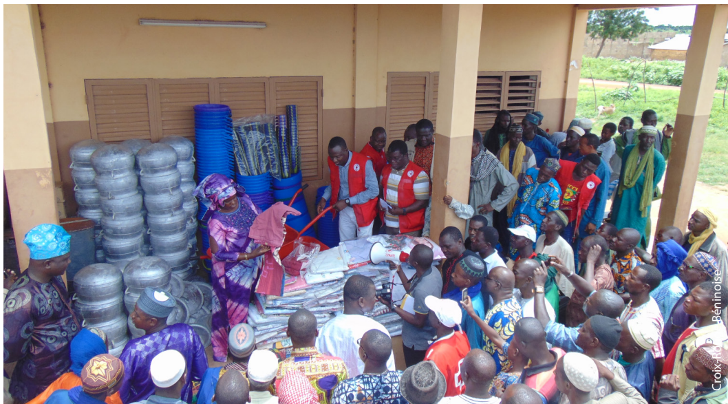
La Croix-Rouge Béninoise remet des matériels de première nécessité à des déplacés dans la commune de Matéri, avant l'émergence de la pandémie.