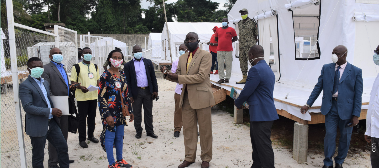
Remise des clés du centre Covid-19 à la MACA.