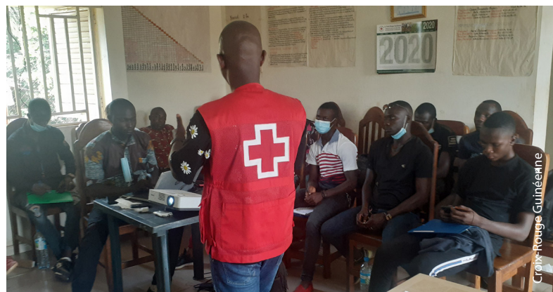
Activité de sensibilisation de la Croix-Rouge Guinéenne auprès des communautés de la préfecture de Coyah.