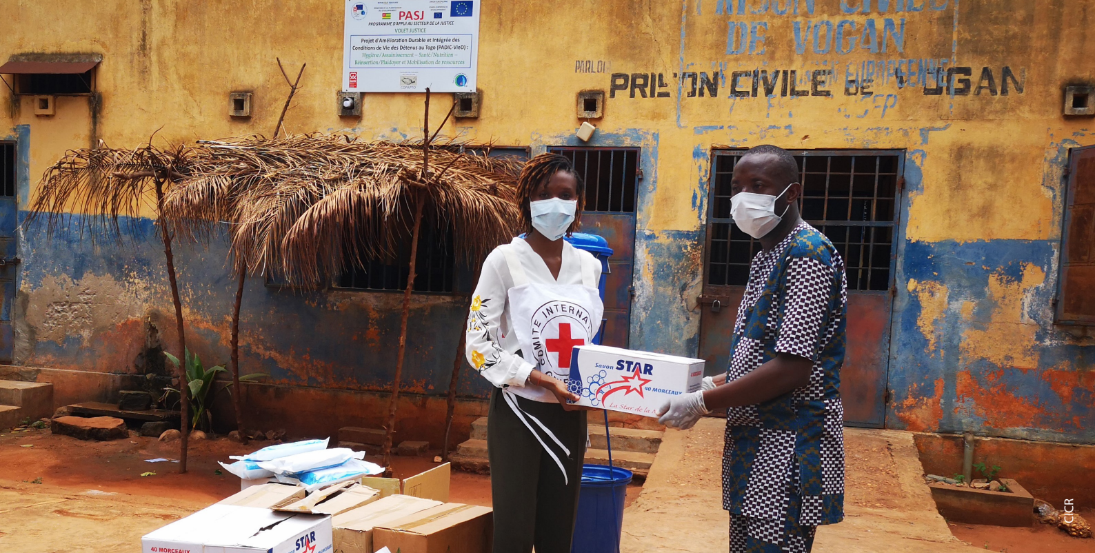
Remise de produits d'hygiène dans une prison au Togo pour prévenir la propagation de la COVID-19.