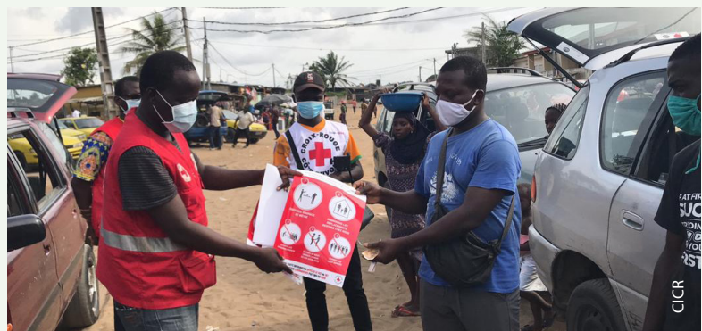
Des volontaires de la Croix-Rouge de Côte d'Ivoire distribuent dans une gare routière des affiches sur les mesures barrières, produites avec le soutien du CICR.