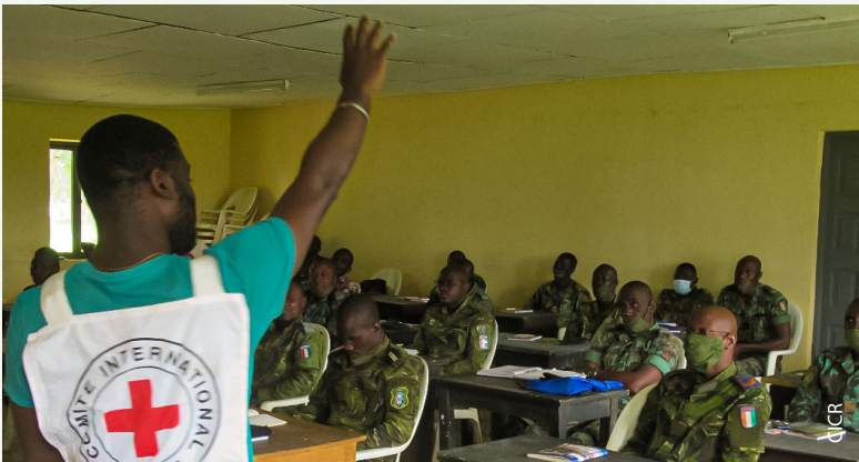
Séance de sensibilisation aux règles du droit international humanitaire à l'attention des Forces Armées de Côte d'Ivoire.

nisé par le Tribunal militaire d'Abidjan.