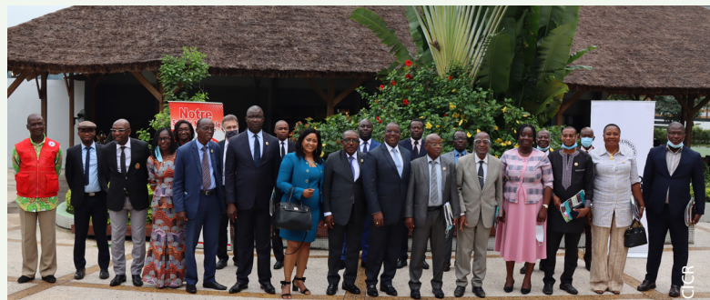
Députés de l'Assemblée Nationale et autres participants à l'atelier sur l'emblème de la croix rouge, en octobre 2020 à Abidjan.