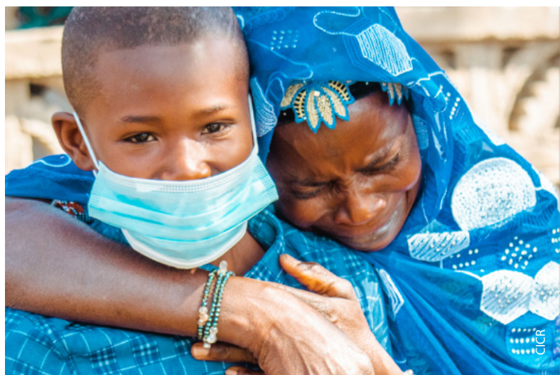
Un garçon retrouve sa famille après quatre ans de séparation, à Guérin-Kouka, un village du nord du Togo.