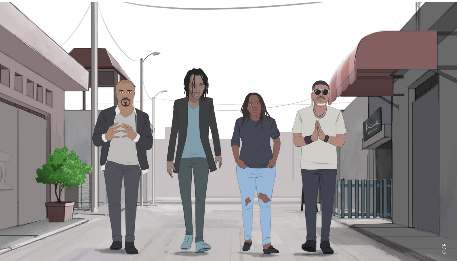
Dessin extrait du clip « Comme un appel », représentant les quatre artistes qui y ont contribué - à retrouver sur Facebook et YouTube.