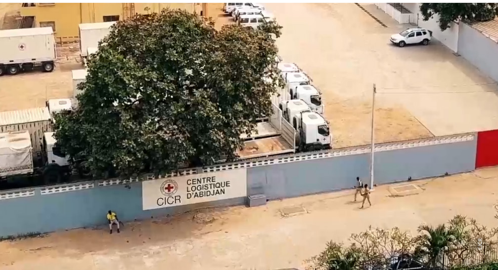
Vue aérienne du Centre Logistique CICR situé dans le quartier de Marcory, à Abidjan.