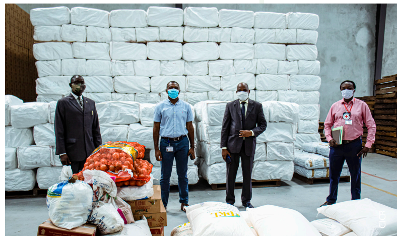
Chargement de vivres au Centre Logistique du CICR à Abidjan, à l'attention de 1'200 détenus vulnérables de quatre prisons en Côte d'Ivoire.