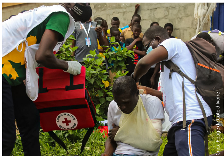
Simulation de secours aux blessés de potentielles violences, organisée à Yopougon par la Croix-Rouge de Côte d'Ivoire.