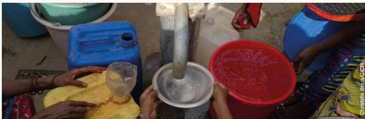
Site de déplacés de Mbella à Kaga-Bandoro. Le CICR y a installé une pompe forage qui a permis aux déplacés de ce site d'avoir accès à de l'eau potable.