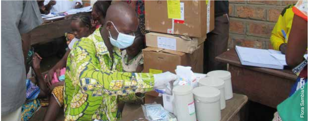
Site des déplacés de Bakouté à Kaga-Bandoro. Clinique mobile organisée par le CICR sur le site pour apporter des soins nécessaires aux populations déplacées de Grévai.