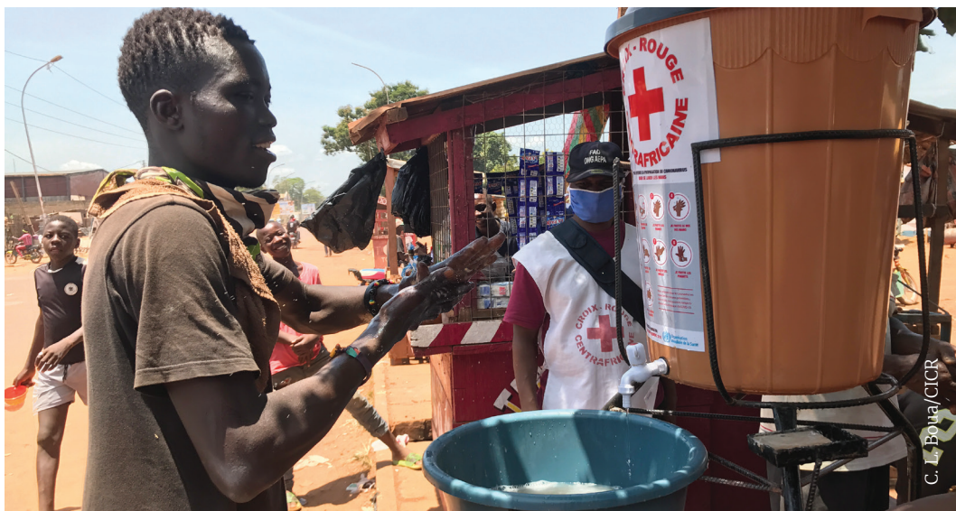
Les volontaires de la CRCA apprennent à leurs communautés comment bien se laver les mains afin de se protéger contre la Covid-19.